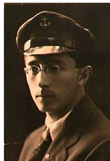
Борис Лавренёв в молодости